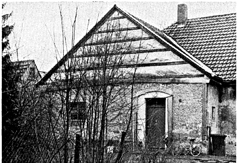
EINSATZ für ein würdiges Leben: Zwei Zimmer in einem Haus mit undichtem Dach (unser Bild) sind die Unterkunft, mit der eine achtköpfige Flüchtlingsfamilie aus dem Iran nun schon seit zweieinhalb Jahren Vorlieb nehmen muß. Versuche der Dachauer Initiative „Arbeitskreis Asyl“, eine annehmbare Wohnung zu finden, waren bisher noch nicht erfolgreich.